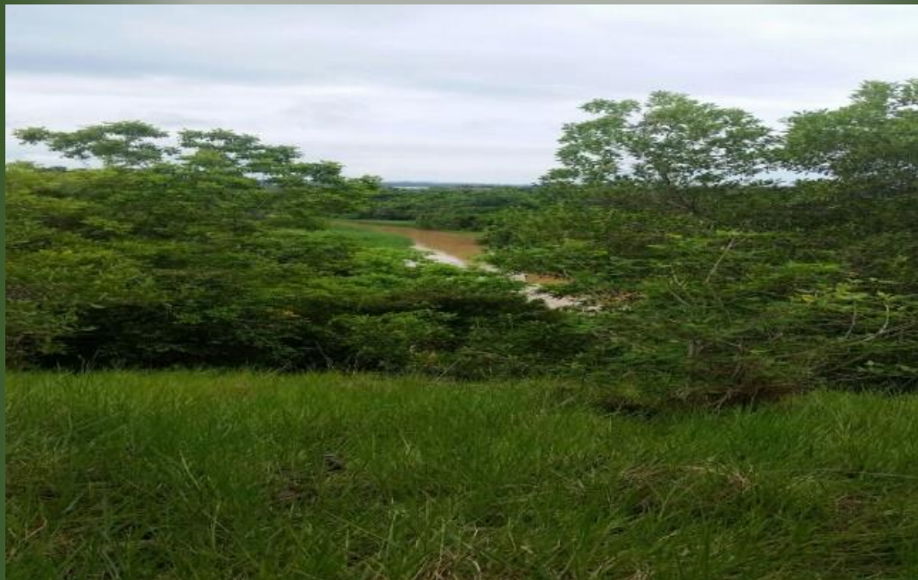
Foto Predio San Ignacio II. Proximidad a la Ciénaga Brava

PRONUNCIAMIENTO SOBRE EL MANEJO DE LAS TRANSFERENCIAS DEL SERVICIO DE ASEO A REDIBA, VIGENCIAS 2016 Y 2017