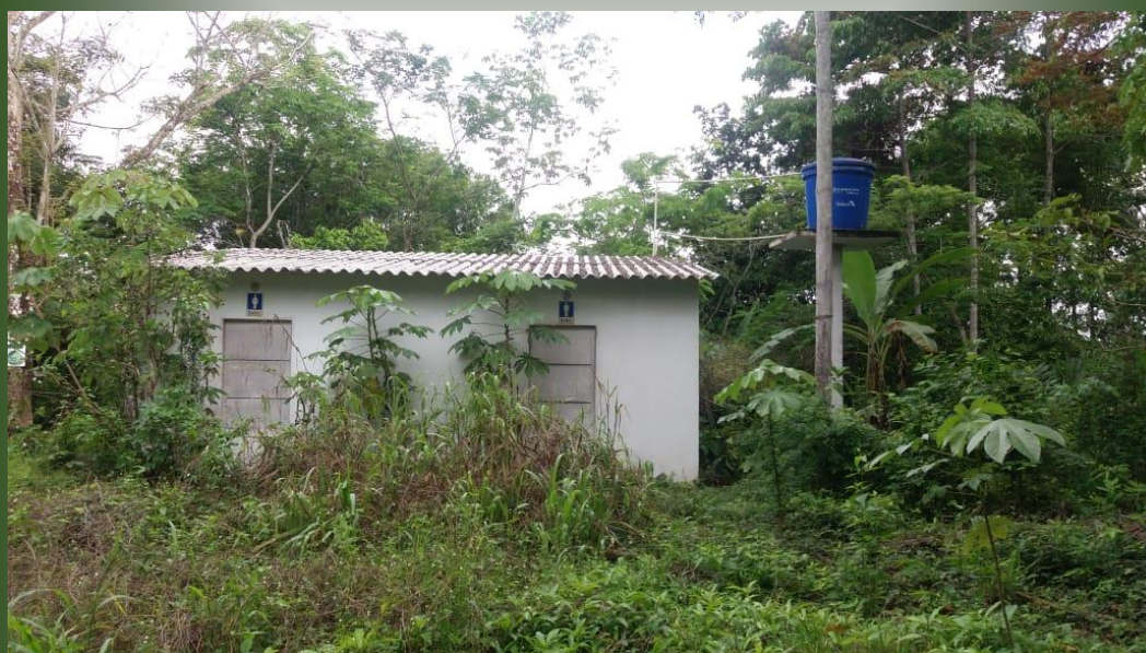
Foto Predio San Ignacio. Batería de baños sin uso

CUMPLIMIENTO DE LA LEGALIDAD AMBIENTAL EN EL MUNICIPIO DE BARRANCABERMEJA