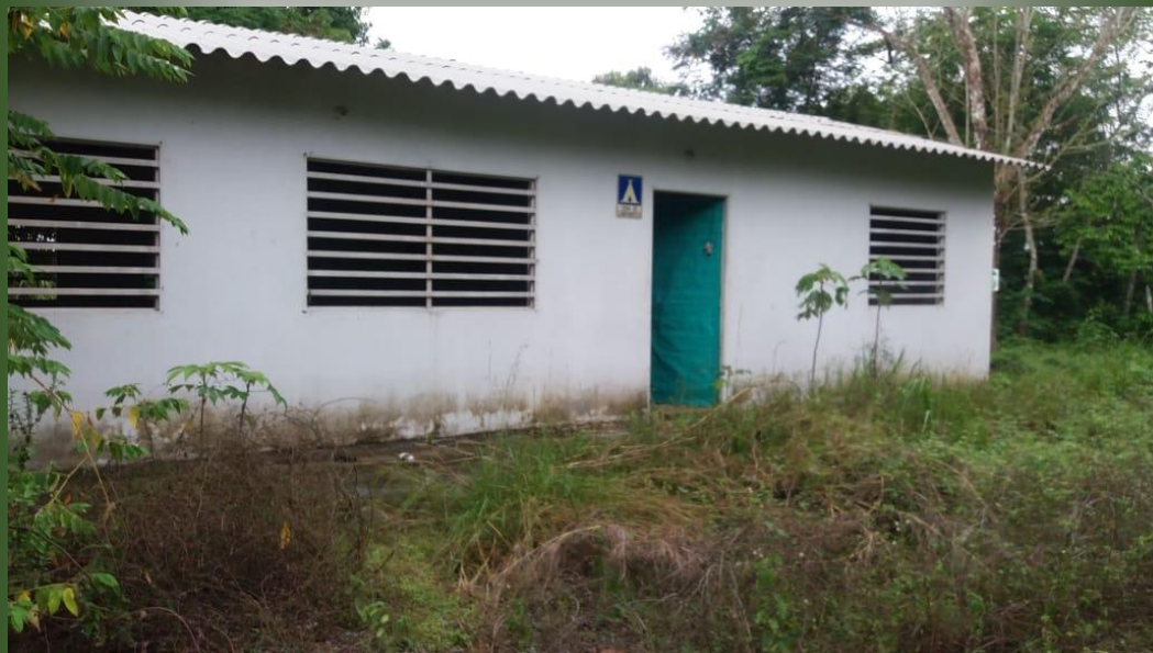
Foto Predio San Ignacio. Infraestructura sin uso.