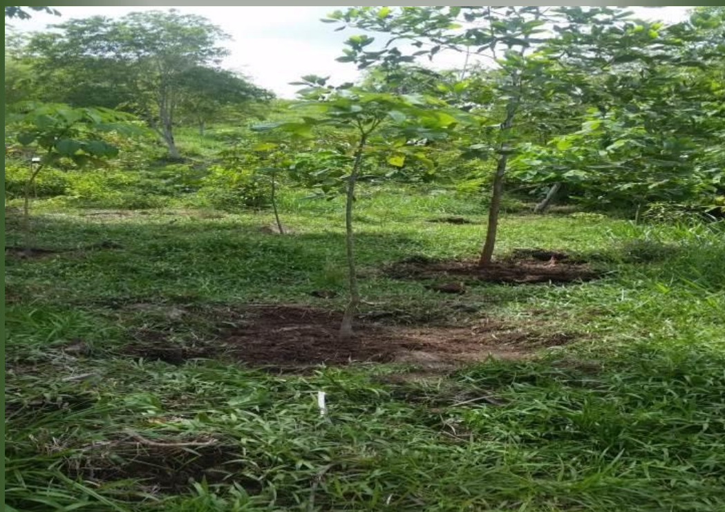
Foto Predio Nuevo Horizonte. Área de importancia estratégica para la conservación de recurso hídrico que surten de agua al acueducto municipal