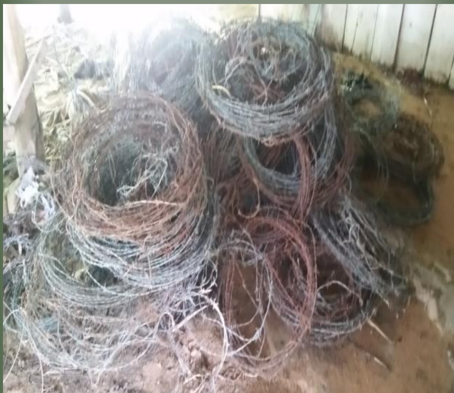
Foto Predio Nuevo Horizonte. Material abandonado