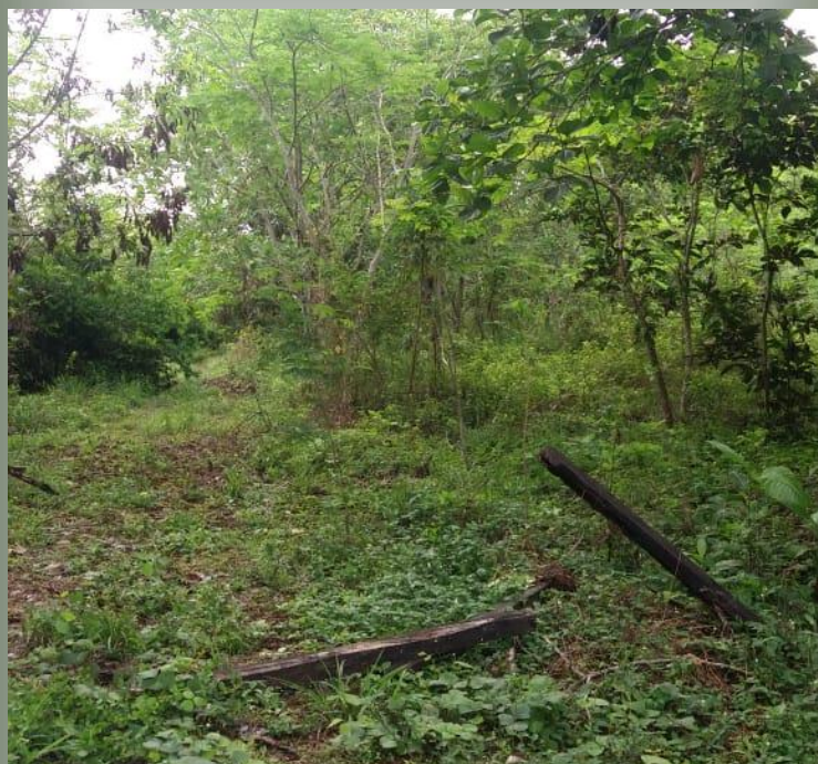
Foto Predio San Ignacio. Cerca de encerramiento caída y si el alambre púa