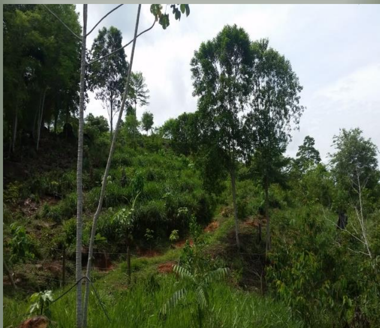
Foto Predio Las Delicias. Área de importancia estratégica para la conservación de recurso hídrico que surten de agua al acueducto municipal