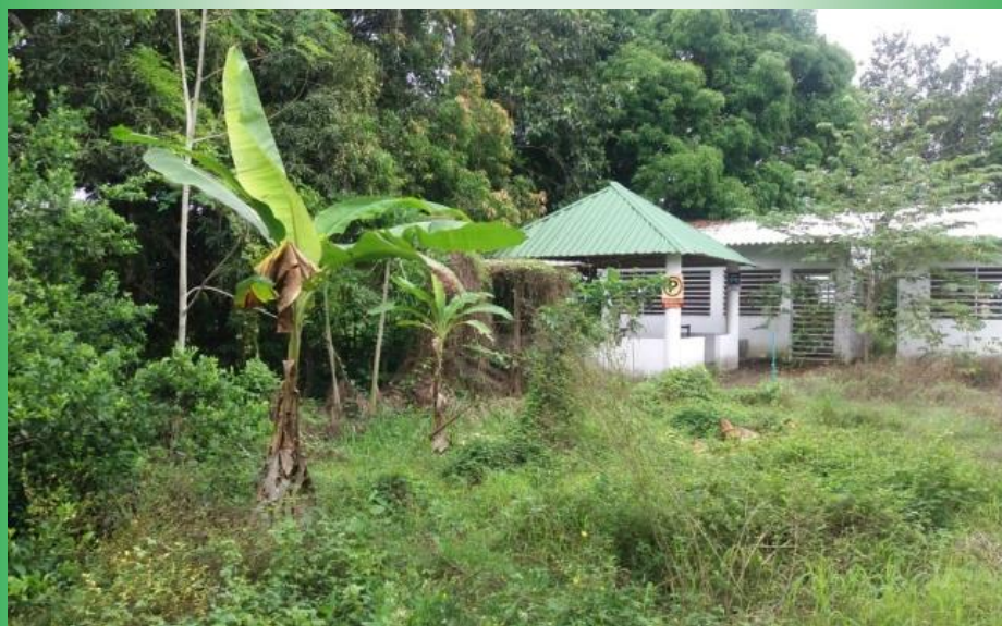
Foto Predio San Ignacio. Área de importancia estratégica para la conservación de recurso hídrico que surten de agua al acueducto municipal

OLIVA OLIVELLA GUARIN CONTRALORA MUNICIPAL