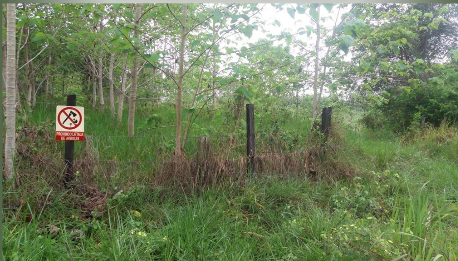
Foto Predio San Ignacio I. Vía enmontada hacia el predio.